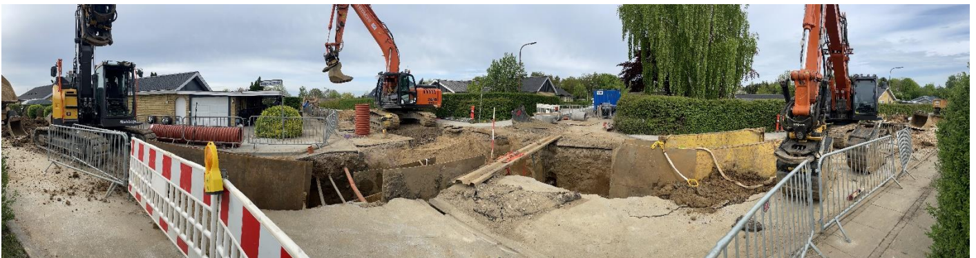
Separering af kloakker ved Aagaard/Gravens

Fredag den 19. august 2022 kl. 8.30 - 10.00