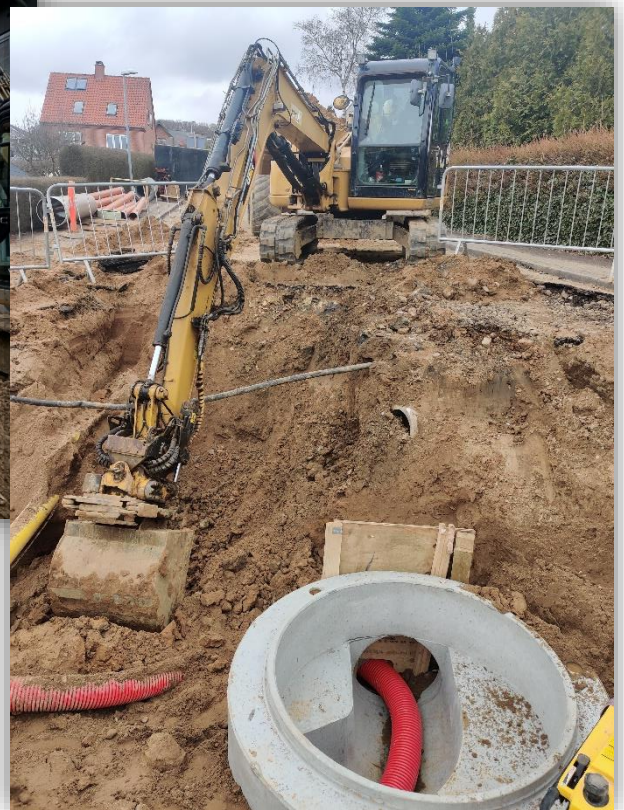
Separatkloakering af Brønshjergvej ved 2. tunnel