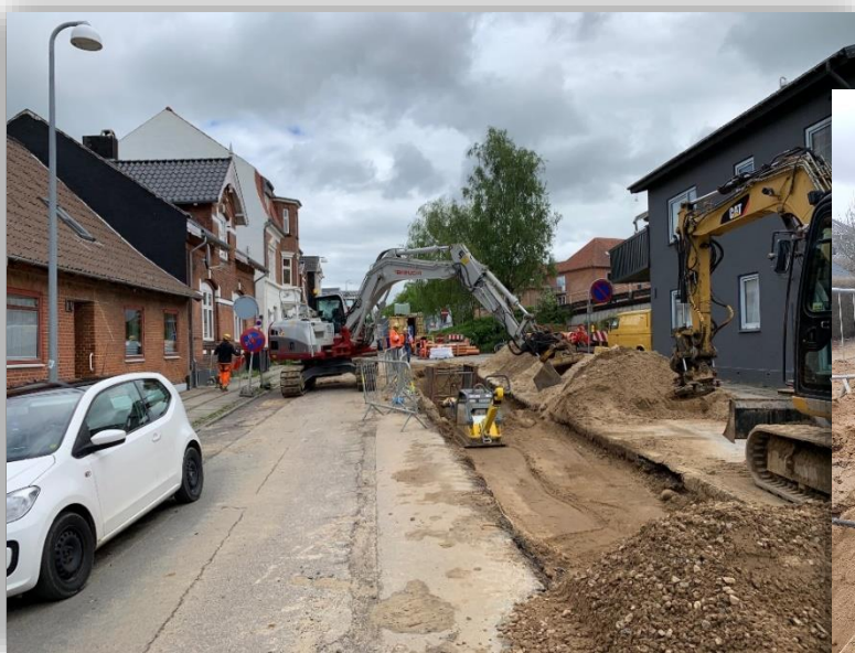
Projektet ved Ribegade

Tirsdag den 15. juni 2021 kl. 8.30 - 10.10