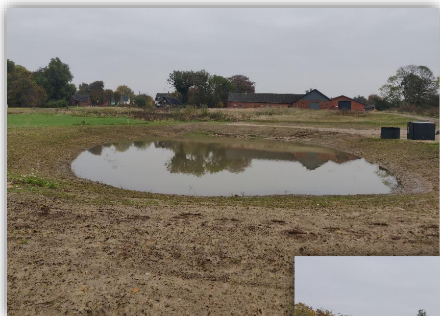
Regnvandsbassiner i Assendrup

Tirsdag den 23. november 2021 kl. 8.30 – 10.15