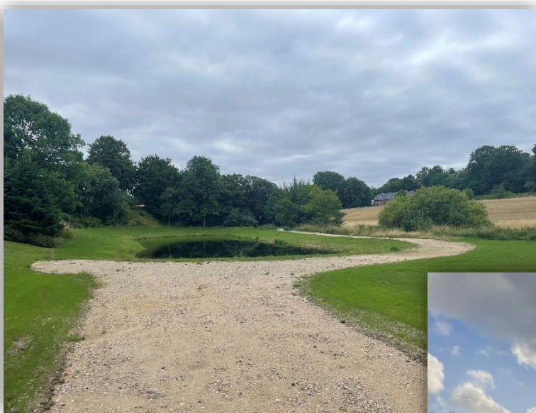
Bassiner i Aagaard

Tirsdag den 7. februar 2023 kl. 8.30 - 10.30