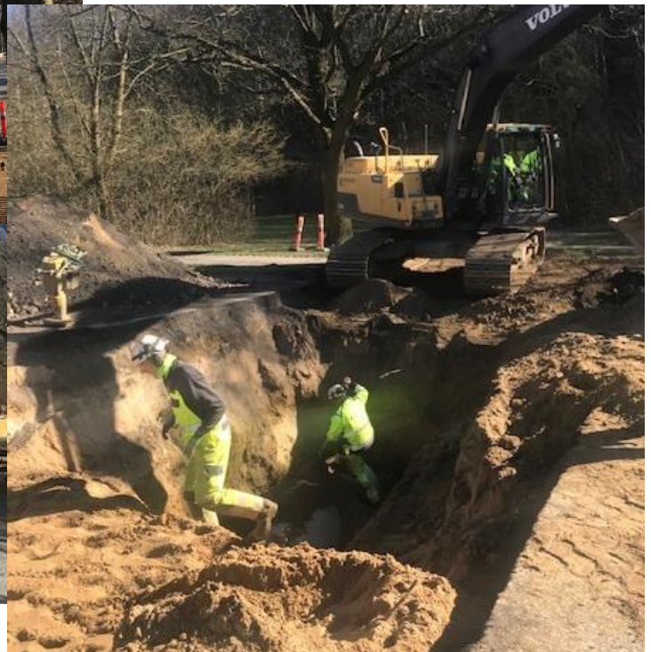
Nedgravning af rør under Østerbrogade