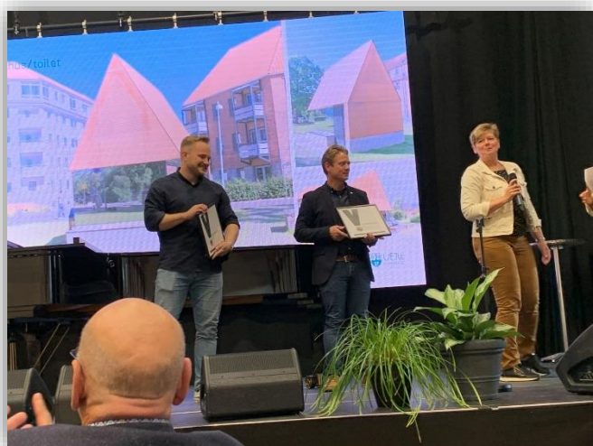
Vi har fået Vejle-Prisen for toiletbygningen på Valdemarsgade

Fredag den 11. november 2022 kl. 8.30 - 10.30