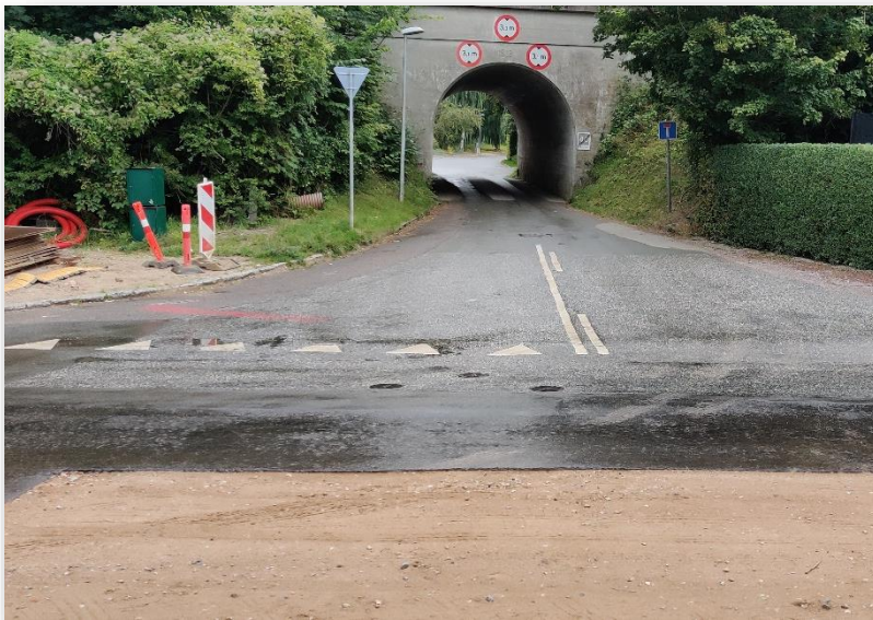
Strandvejen ved 3. tunnel - færdiggøres inden bestyrelsesmødet

Fredag den 11. september 2020 kl. 8.00 - 9.05